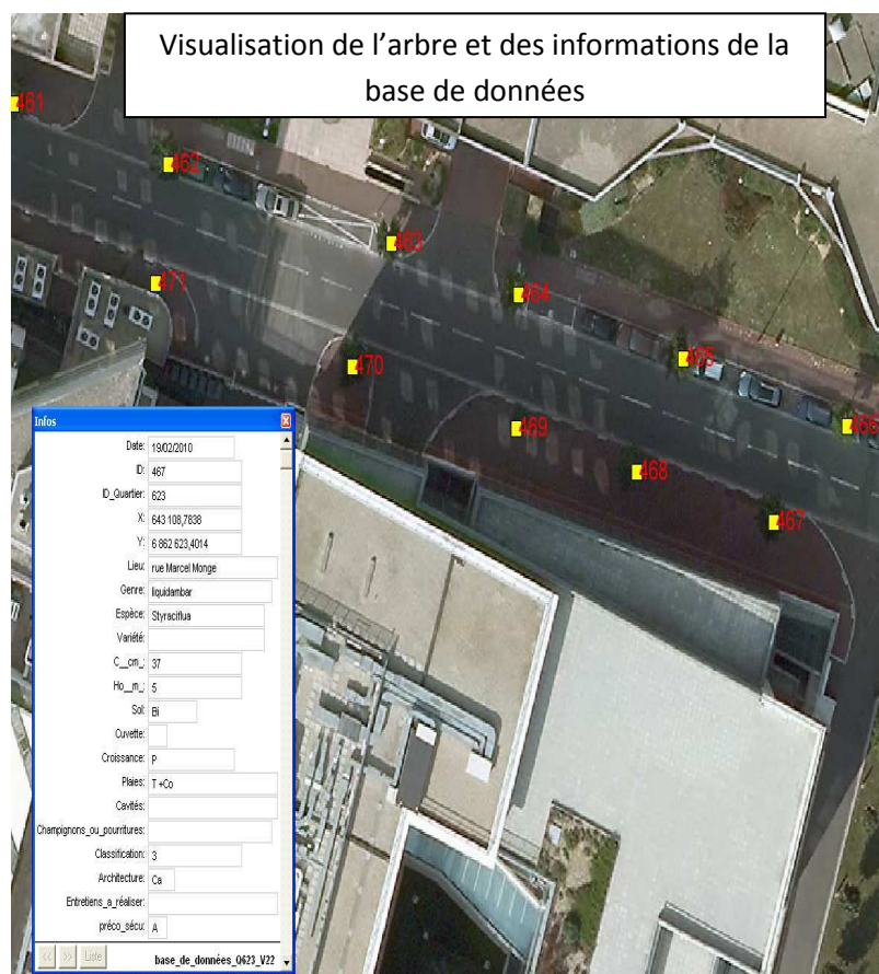
Visualisation de l'arbre et des informations de la base de données

Le SIG permet d'observer l'arbre sur une photo aérienne et de visualiser en même temps les résultats de l'expertise de terrain.